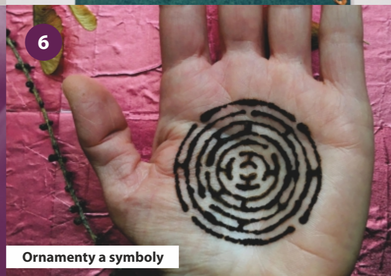
Ornamenty a symboly