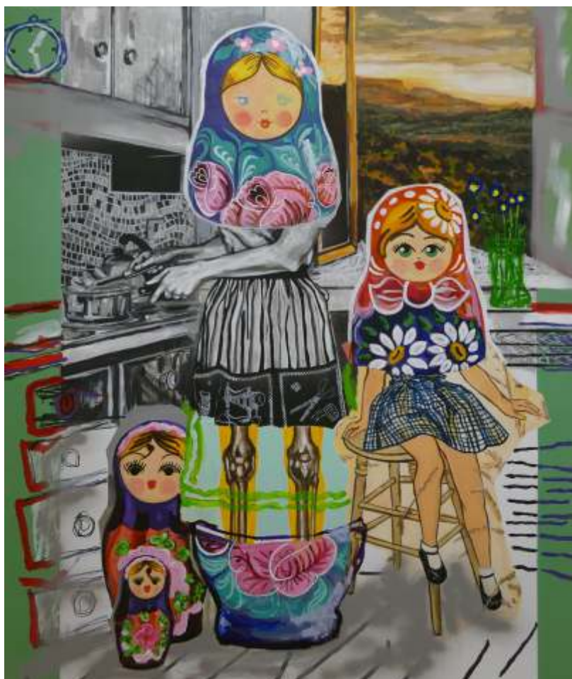
Vladimíra Weiss Matrioška, 2017 akryl, plátno

Inšpiruj sa dielom od Vladimíry Weiss a dotvor obrázok matriošky spojením techniky perokresby a výšivky!