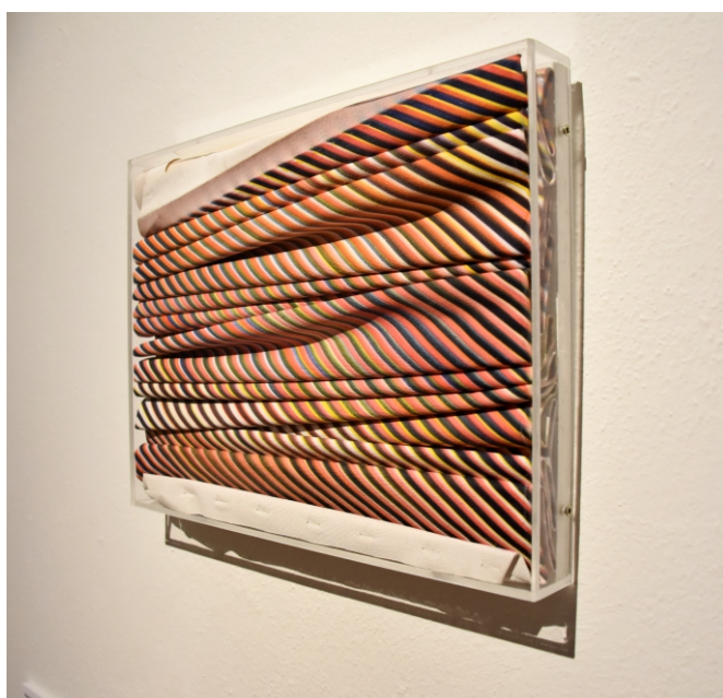
Martin Kudla Painting zip file, 2020 plexisklo, akryl na plátne