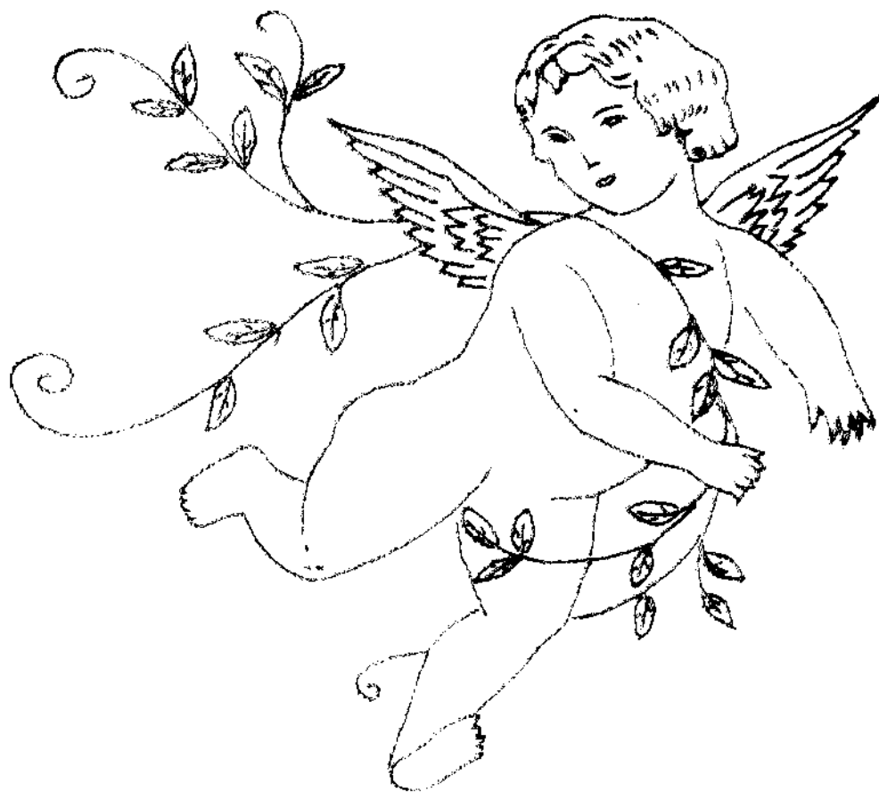
Predloha anjela na vytvorenie textilnej koláže.