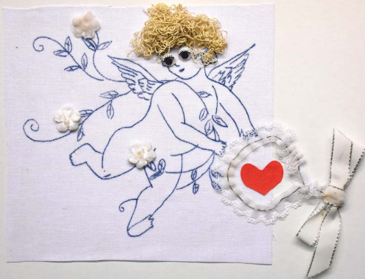
Ukážka hotovej textilnej koláže.